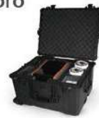
Estuche Rígido Portatil**